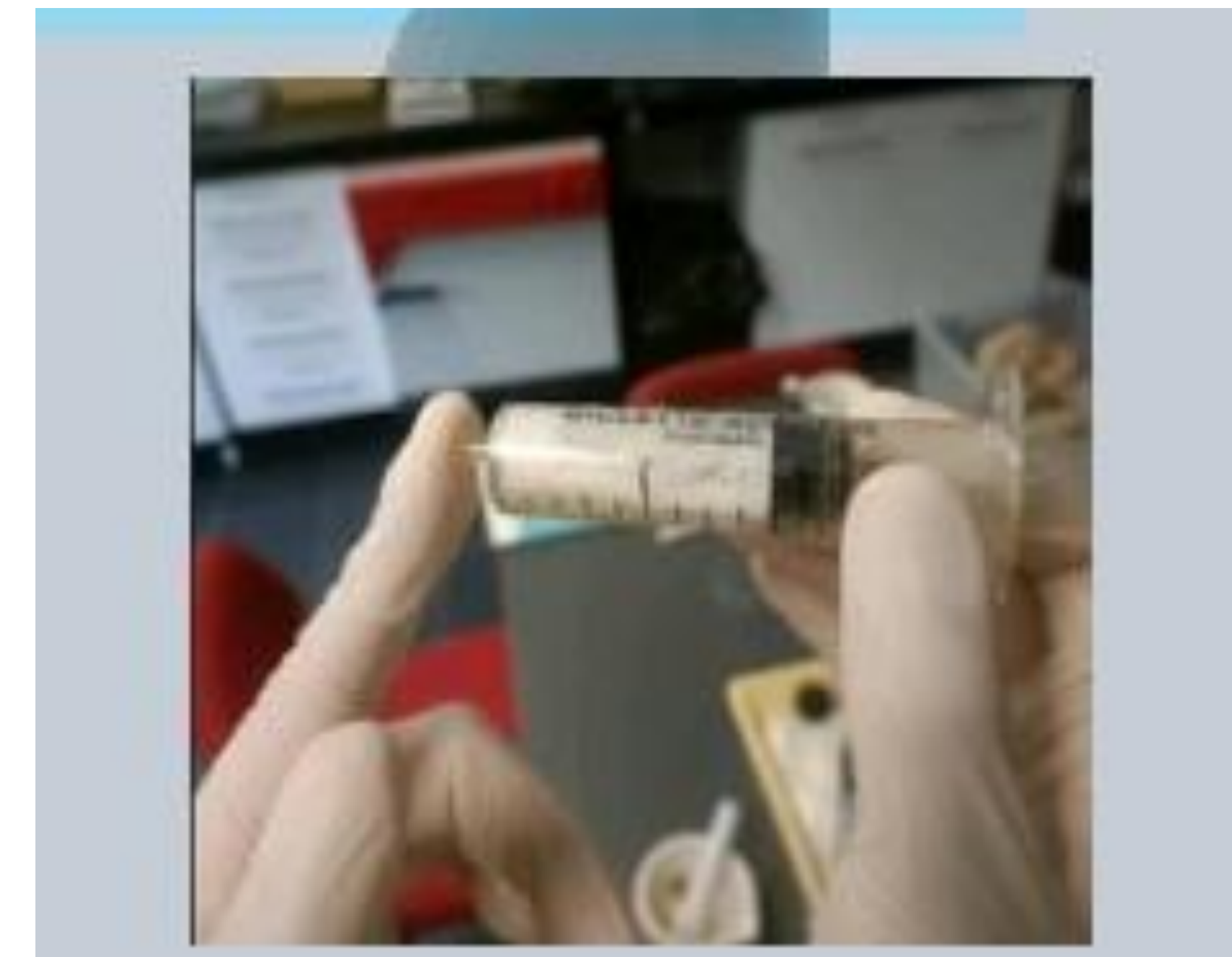
Fig. 4- Teste do êmbolo da seringa