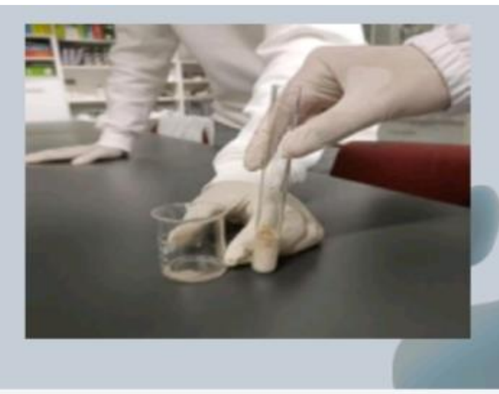
Fig. 2- Solução em que atua a catalase